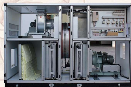
Thiết bị nhiệt ẩm Drymax dùng trong qui trình sấy âm nhiệt (sub-zero)

* Buồng sấy được làm bằng panel cách nhiệt dày 100mm, đảm bảo tiết kiệm năng lượng sấy.