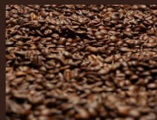
Sấy cà phê, trà