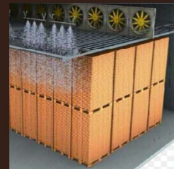
Sấy trái cây, rau củ, dược liệu...(dòn/dẻo) giữ màu, hương vị tự nhiên Sấy thực phẩm, gỗ, mây tre lá...tiết giảm chi phí